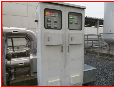
冷却塔運転制御盤 (4. 計装 (電装品))